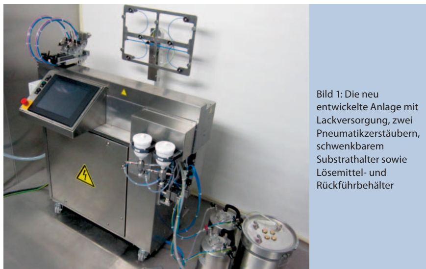
Bild 1: Die neu entwickelte Anlage mit Lackversorgung, zwei Pneumatikzerstäubern, schwenkbarem Substrathalter sowie Lösemittel- und Rückführbehälter

Wörwag wählte eine fast vollständige Komplettausstattung mit zwei Zahnradpumpen. Einzig auf die Fließbecher-Automatikpistole wurde verzichtet. Da-